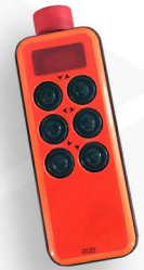
Optional: Drahtlose Fernbedienung