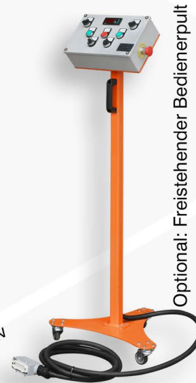
Optional: Freistehender Bedienerpult